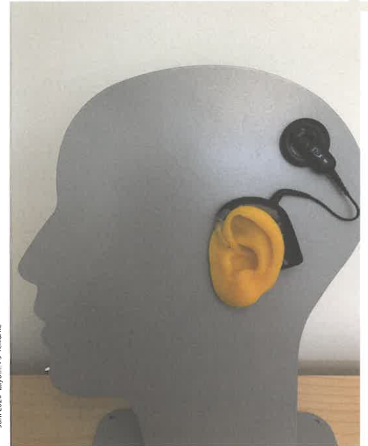
Juni 2020 - Layout: FS' reklame

CKU i Skive Arvikavej 1-5 7800 Skive Tel: 99 15 76 90 Telefontid mellem 8-12 cku@skivekommune.dk