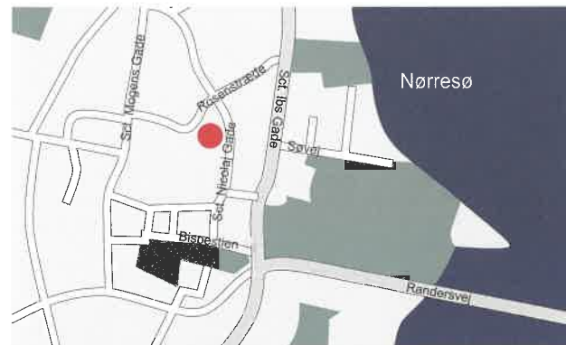
CKU i Viborg