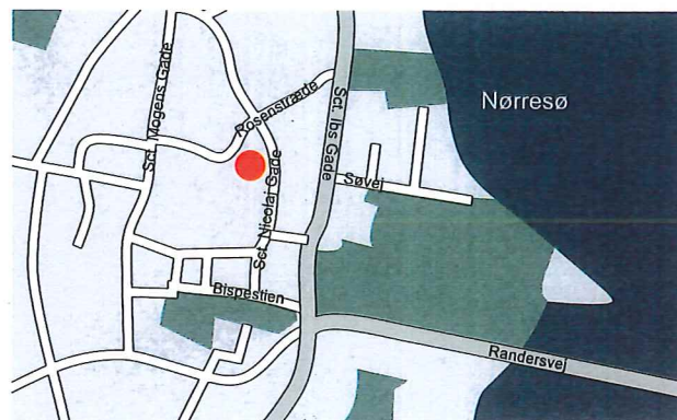
CKU i Viborg