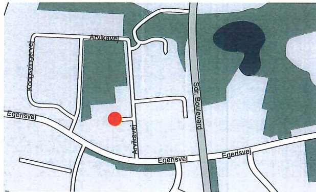
CKU i Skive

årørende i et tæt samarbejde, er med sygehuse, praktiserende sykologer, kommunale sagsbe- iter, hjemmeplejen og andre